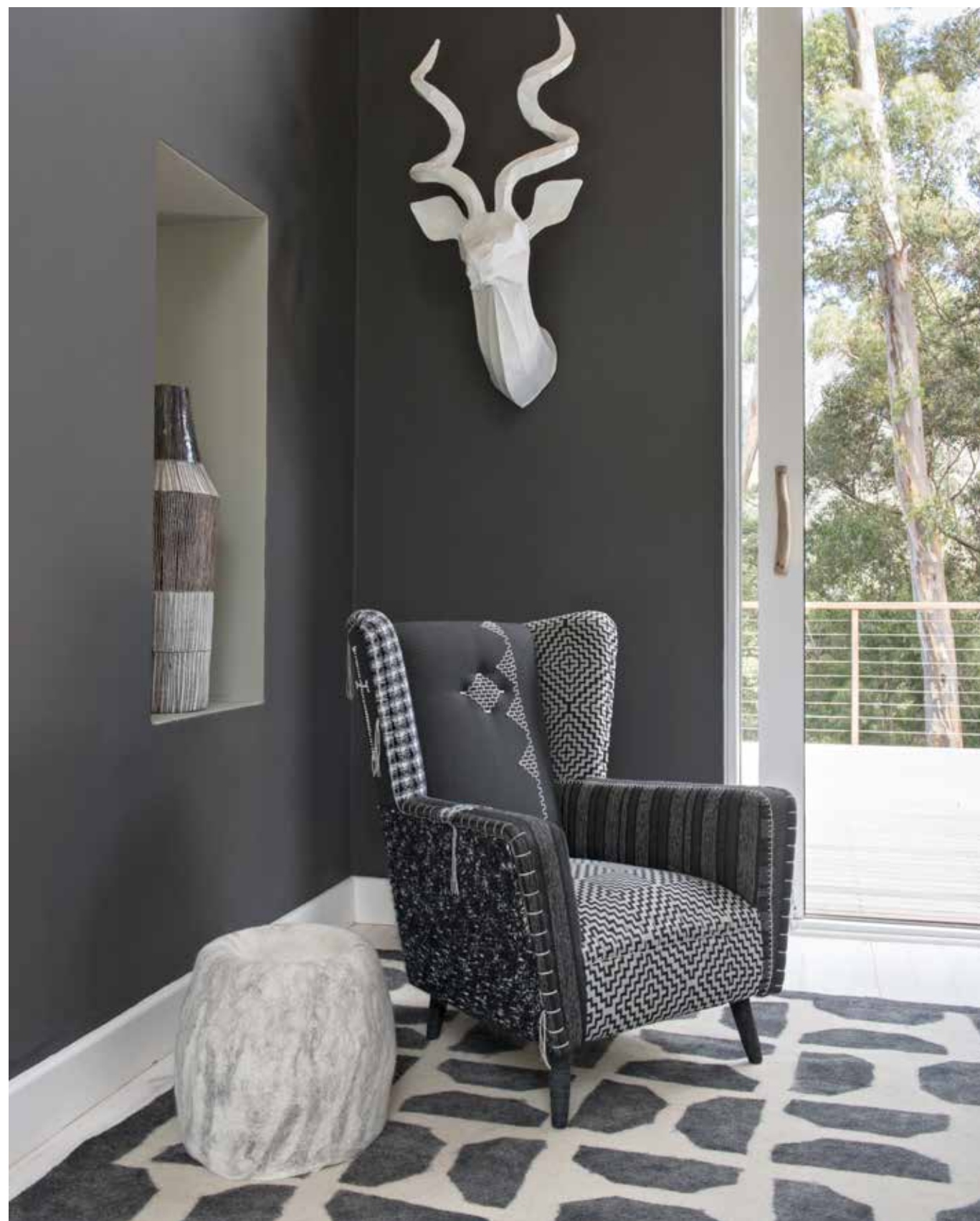
À GAUCHE Dans un coin du salon, le fauteuil conçu sur mesure dans un patchwork de tissus gris puis rebrodé est une création de Starry-Eve Collett pour sa marque Casamento. Pouf en feutre, Chic Fusion. Au mur, trophée en papier mâché, Michael Methven. Dans la niche, vase de l'artiste Louise Gelderblom. Au sol, un tapis en feutre rapporté du Népal. À DROITE Dans une spacieuse pièce reliant les différentes chambres de la demeure, un coin salon a été aménagé avec un canapé en édition limitée signé Ardmore. Singe en perles, MonkeyBiz. Au mur, œuvres de l'artiste S. Pratt. Au sol, peau de vache dénichée sur un marché local.